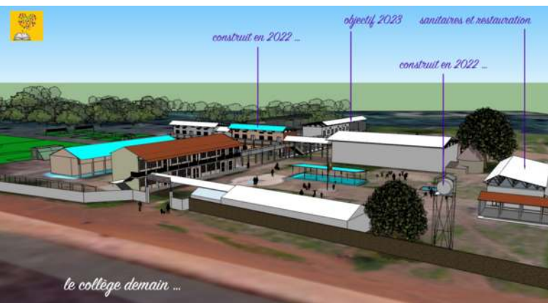
Le projet final

Ces ouvrages sont le point de départ d'un projet plus ambitieux pour agrandir le collège (et absorber les effectifs qui ne cessent de croître), celui d'un grand complexe scolaire évolutif composé de plusieurs autres bâtiments dont une salle de restauration avec cuisines, des sanitaires, un laboratoire et une bibliothèque, un bloc administratif, des terrains de jeux, une grande salle d'accueil avec un gymnase et une chapelle, ainsi que 4 autres classes. C'est un projet global qui se construira pas à pas en fonction de la générosité de nouveaux donateurs. Le Père Mérimé, parti pour poursuivre des études à Rome a été remplacé par le Père Binet Awanou qui s'investit dans le projet avec le même dynamisme et la même flamme.