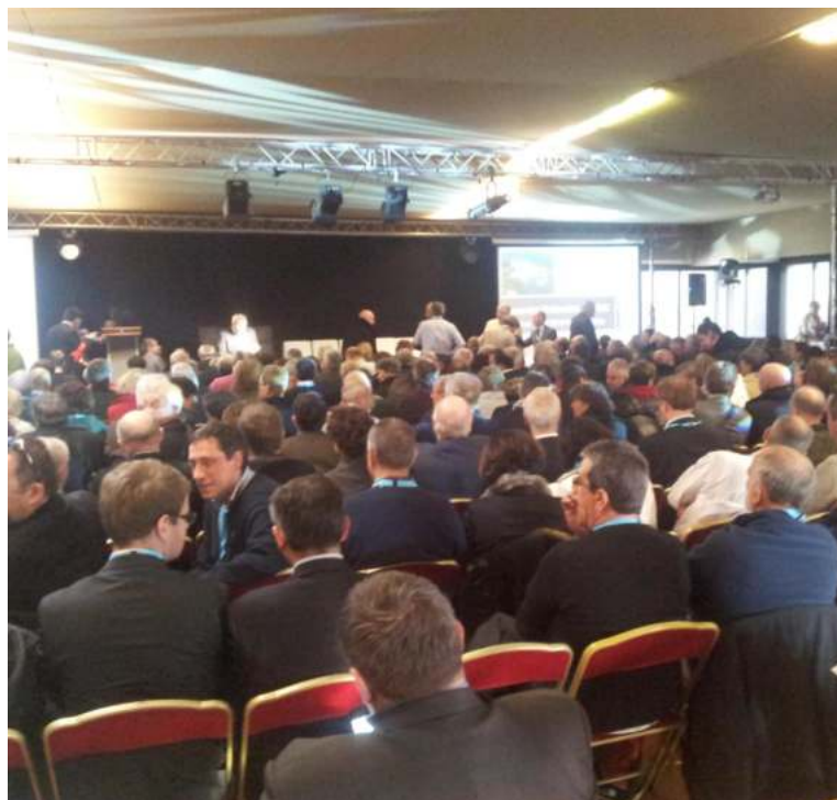
Lancement officiel du référentiel Gouvernance aux JN 2013 - Les Embiez