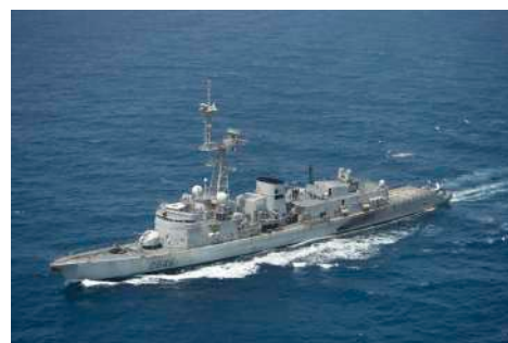
La frégate anti-sous-marin Latouche-Tréville