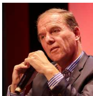
L'amiral Loïc Finaz @JT21

Or, dans un monde de plus en plus déboussolé, l'amiral s'est toujours orienté d'après quatre points cardinaux qui font les repères d'un chef : "la mission que l'on m'a confiée, le sens que je lui donne auprès de mon équipage, la prise en compte des circonstances qui l'influencent et les hommes qui m'aident à la réaliser" . C'est sur ce dernier point qu'il est profondément habité par une conviction : "Une gouvernance équilibrée, c'est à la fois une dimension hiérarchique pour réagir vite, en particulier en situation de