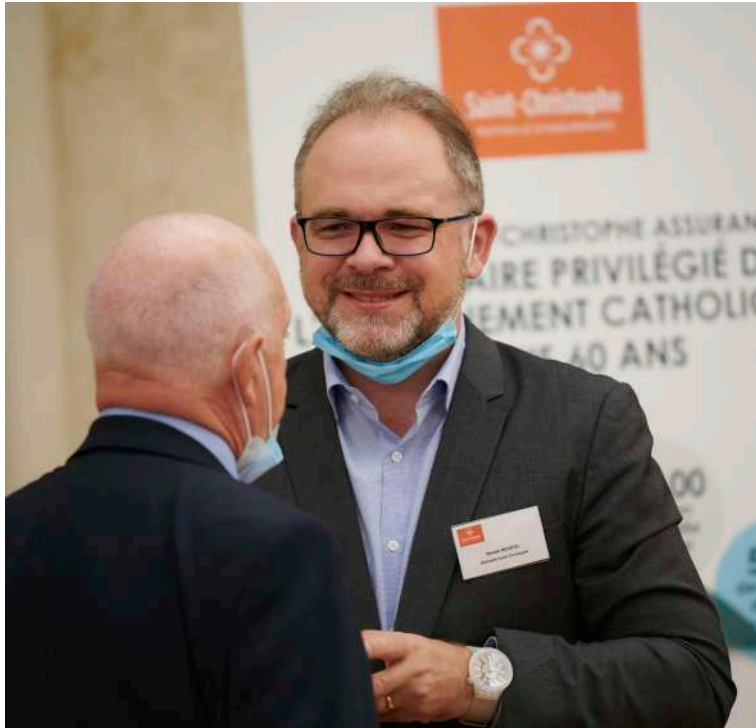
© Christophe Passenaud - "Dans l'union, il y a de la force." (Esope)