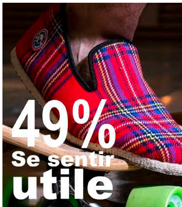
La principale motivation du bénévole

Comme n'importe quel collaborateur, un bénévole a lui-aussi besoin d'être motivé pour s'engager