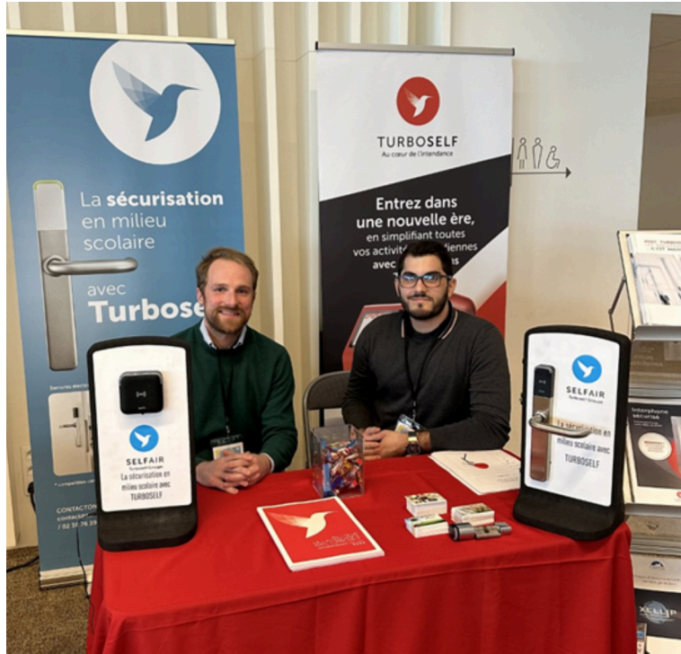
L'équipe de TurboSelf aux Journées de la Fédération