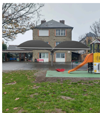
Cour de l'école Sainte Anne (visuel non contractuel)

puis quelques mois, une très forte hausse des coûts non prévue et, espérons-le, momentanée, liée à l'inflation et à l'énergie. Avec sa plateforme de financement participatif Jaidemonecole.org, la Fondation Saint Matthieu se mobilise pour les aider à trouver des ressources supplémentaires grâce à la générosité publique. La FSM Ouest a pu ainsi proposer aux établissements catholiques de lancer des campagnes d'appel à dons de solidarité. Merci à la Fédération nationale des Ogec de nous avoir permis de rencontrer les écoles pour lesquelles nous travaillons au quotidien.